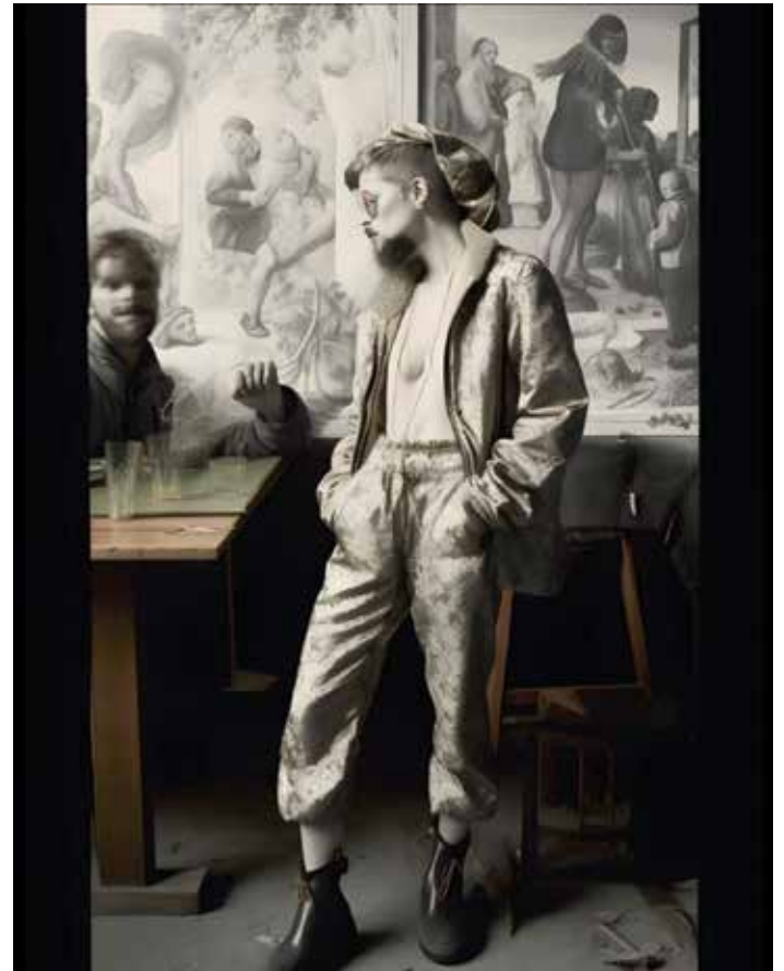
Florian Adolph, „PUB“, 2023 Siebdruck auf Alu-Dibond, 80 x 60 cm, (Unikat)

Einführung und Beispiele zum Einsatz von bild-, text- und soundbasierten KI-Tools und deren Potenzial für Ihre Arbeitspraxis. Neben der praktischen Anwendung wird auch eine kritische Einordnung und die Bedeutung der Technologie in Bezug auf neue Entwicklungen diskutiert und mögliche Perspektiven aufgezeigt. (Voraussetzung: Rechner/Laptop, Internetzugang). Florian Adolph arbeitet als Künstler selbst mit KI und gibt einen Überblick über die verschiedenen KI-Tools wie „Midjourney“, „ChatGPT“ und andere. In diesem Workshop werden diese gemeinsam auf mögliche Anwendungen in der eigenen Praxis getestet. Kursleitung: Florian Adolph / Samstag 11–15 Uhr, Sonntag 11–15 Uhr, 2 Veranstaltungen, 11.10. u. 12.10.25, Kursgebühren: EUR 100,- zuzügl. Arbeitsmaterial EUR 25,- welches bei den Teilnehmer*innen verbleibt.